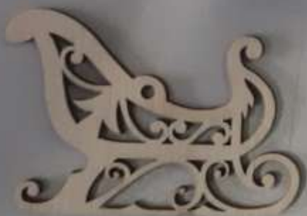
Декоративная фигурка - санки